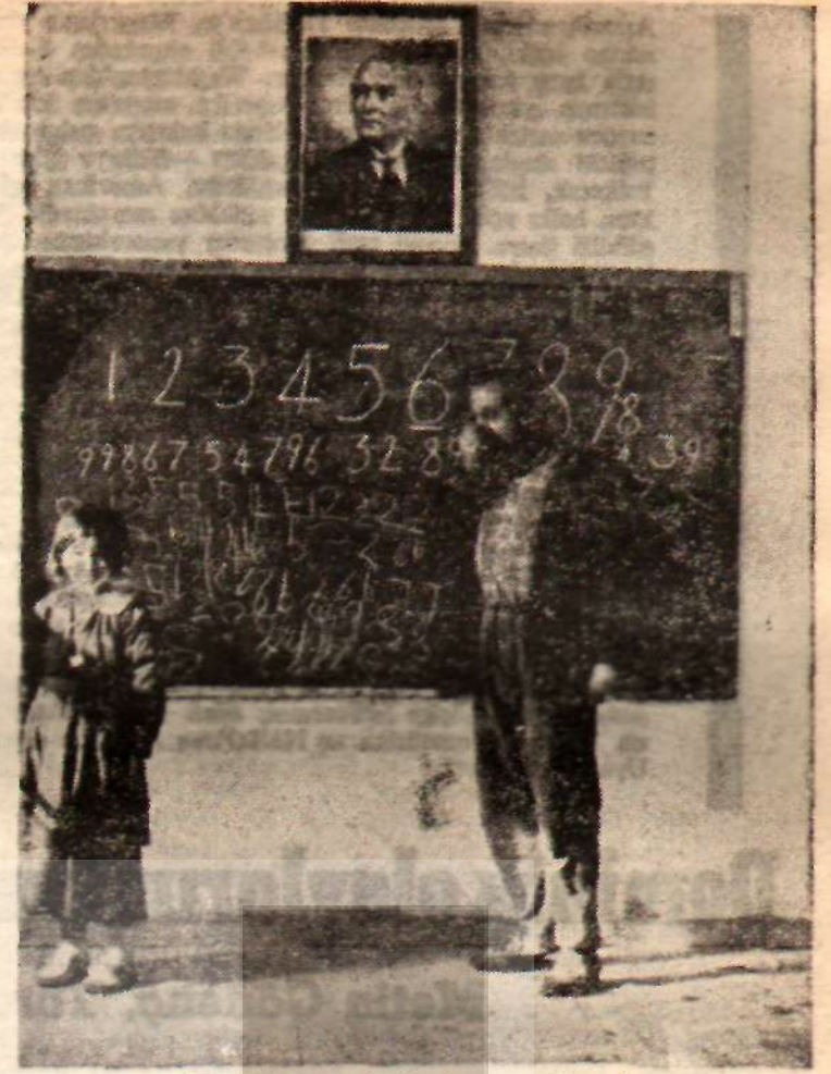
Bir köy okulunda öğretmen ve öğrenci

Millî Eğitim Bakanlığınca göre, «bugün 4.448.000 olan okuma çağındaki çocuktan şehirlerde 1 milyon 409.397 ve köylerde 2 milyon 212.052 olmak üzere 3.622.349 u okula ve öğretime kavuşturulmuştur ki, bu, okuma çağındaki çocuklarımızın % 81,4 ünü teşkil etmektedir. Okuma çağındaki çocuklarımızın % 18,6 sını teşkil e-