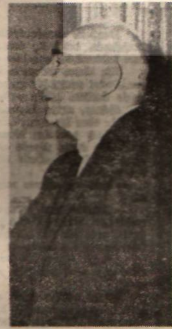
Cumhurbaşkanı Gürsel Gerekli söyledi

Gürsel'in bu beyanları Bakanlar Kurulunda sınırlı sahnelere yol açtı. Fakat yine de dört Bakan, «millileştirmeyi gasp sayanlara» değil, Gürsel'e hak verdi. Artık anlamak gerekir ki, petrol meselesi millete mal olmuştur, hemen millileştirmeye gidilmese dahi, Petrol Kanunu mutlaka değiştirilecektir. Nitekim A.P. Grubu dahil, Petrol Kanunu değişiklik teklifinin en kısa yoldan karma bir komisyonunda görüşülmesine evet demek zorunda kalmıştır. Gerçi bunda «nasıl olsa seçimlerden önce çıkmaz» düşüncesinin büyük payı vardır, ama seçimlerden sonra kanun herhalde değişecektir.