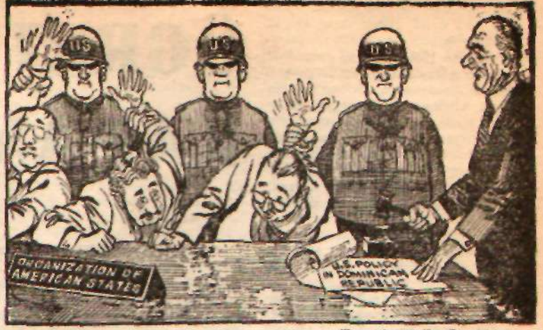
— Toronto Daily Star'dan — AMERIKAN DEVLETLER TEŞKİLATI OYLAMADA

kinkinden çok, kendi çıkarlarını düşünün lâf cambazlarıdır çoğu. Gerek politikacı ve gerekse basının büyük bir kısmı yalnızca kendi menfaatleri uğruna hareket eder. Halkın dikkatli daima başka sahalara çekilmeye uğraşmakta ve dertler hasır altı edilmektedir. Bunun yanında ise, geniş bir kültürden ve ciddi iktisadi, politik ve sosyal bilgilerden yoksun hoyrat bir emniyet teşkilatı çok yere birçok memleket-severi mümlenek ve dosyalar