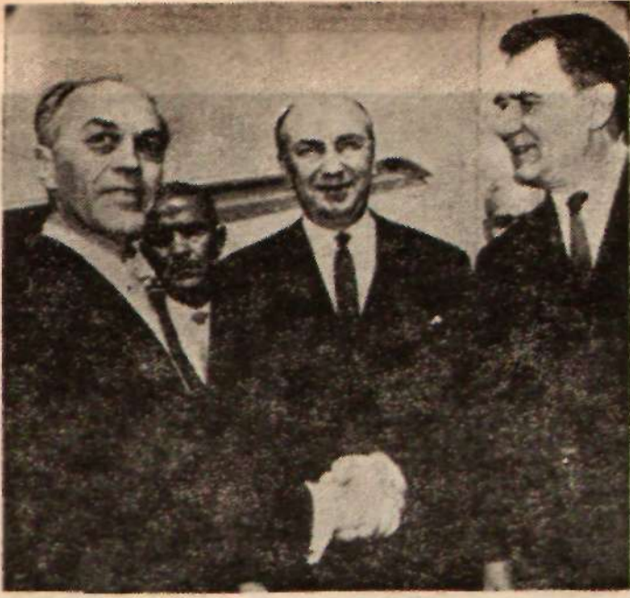
Dışişleri Bakanı H. Işık — Büyükelçi Rijov — Gromyko Mesafe aldılar

tabilecek davranışlardan çitizlikle kaçınmak zorundadır. Halkımızı ve basınıımızı, Anayasayı bu gibi hareketler karşısında savunmaya çağırıyoruz. Anayasayı çiğneyenlere veya tasvakiyanlara sorumluluklarını bir kere daha hatırlatırız. Bütün bu tertiplere rağmen, emekçi halkımızın biricik temsilcisi Türkiye İşçi Partisi'nin Parlamento'ya gireceğinden ve politikamızı emekten yana iteleyeceğinden asla şüphe edilmesin.»